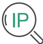
Outil de Vérification IP